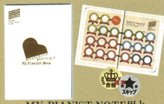
MY PIANIST-NOTE用と 合格シール