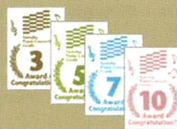
合格回数に応じて 記念バッジを進呈