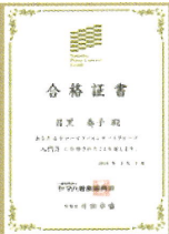
合格証が発行されます

ヤマハ音楽振興会認定の2名のアドバイザーより、一人ひとり1曲ずつの評価とコメントをもらいます。